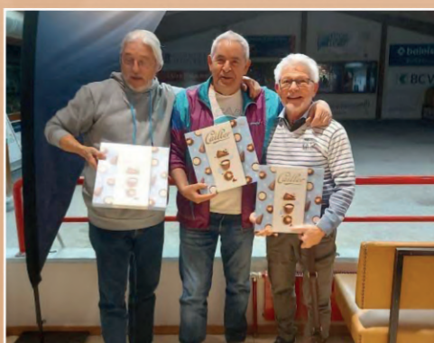
2 e du concours B: Le Club des Vingt de Marcel Jost.