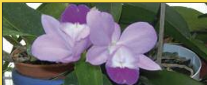
Après 6 ans de patience, une orchidée de la famille des Cattleya exclusive du Japon, non commercialisée en Europe (pièce de collection).