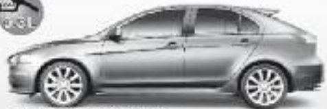
NOUVEAU: Lancer Sportback Sixième génération, 1800 cc, 16V, 170 km/h, 10.5 l/100 km Avec 1800 cc, 16V, 170 km/h, 10.5 l/100 km.

MITSUBISHI LANCER Sports Sedan et Sportback sont des véhicules destinés à l'usage personnel. Ils ne sont pas destinés à être utilisés pour des travaux de transport de personnes ou de marchandises. Les performances indiquées sont des performances moyennes. Les performances réelles peuvent varier en fonction des conditions d'utilisation. Les performances réelles peuvent varier en fonction des conditions d'utilisation. Les performances réelles peuvent varier en fonction des conditions d'utilisation.