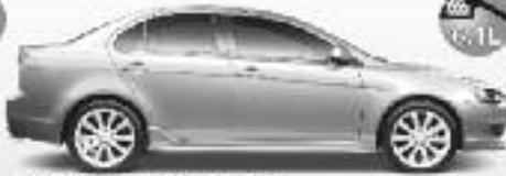
NOUVEAU: Lancer Sports Sedan Sixième génération, 1800 cc, 16V, 170 km/h, 10.5 l/100 km La sportivité et le confort au meilleur des mondes.