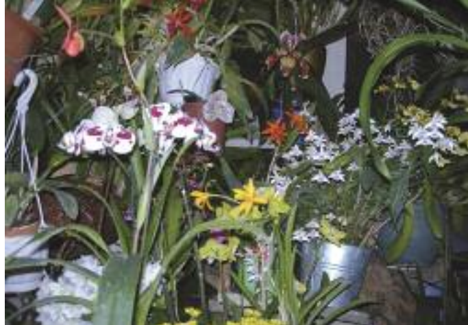
Quelque part à Montreux, une centaine d'orchidées en fleur dans un havre de paix et de bonheur.

«Qui cesse d'être ami ne l'a jamais été.» Hiéron